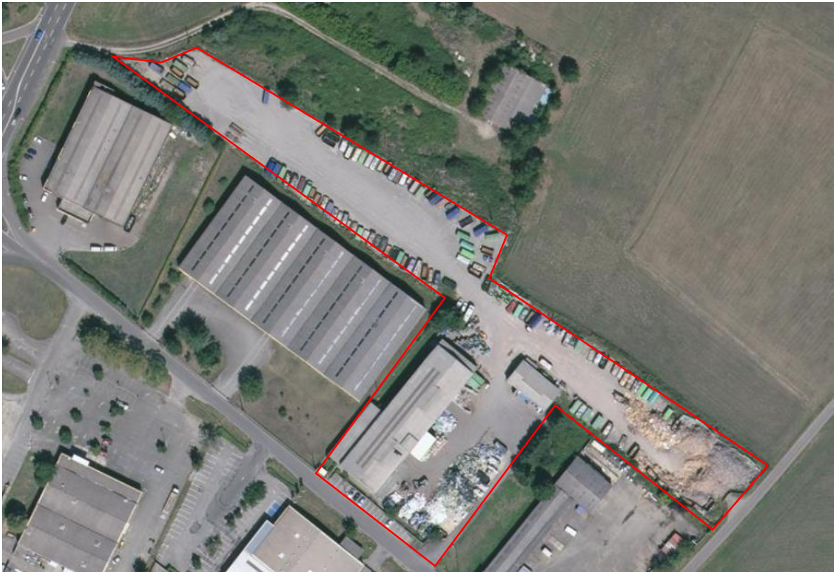
Photographies aériennes du site - 2019