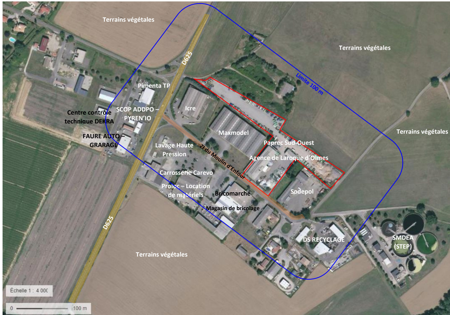
Plan des abords du projet au 1/4000 - 2019